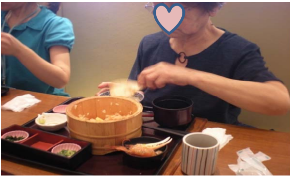
みなさんおひつご飯をペロリ♪