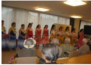
デイルームで フラダンスに 参加しました