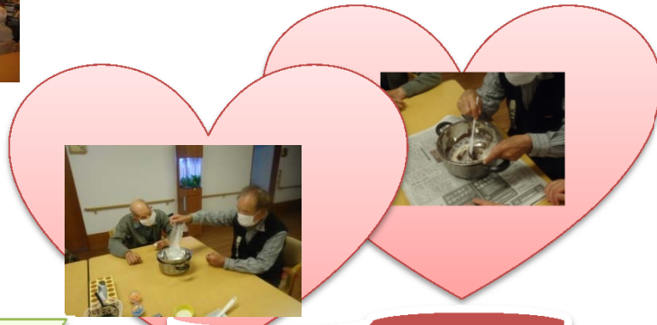
ありがとうの気持ちを込めて