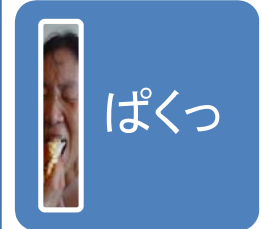
やじろべえでランチ