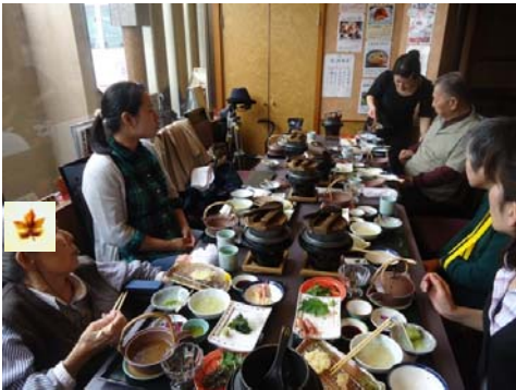
外食レク 松茸ご飯に舌鼓