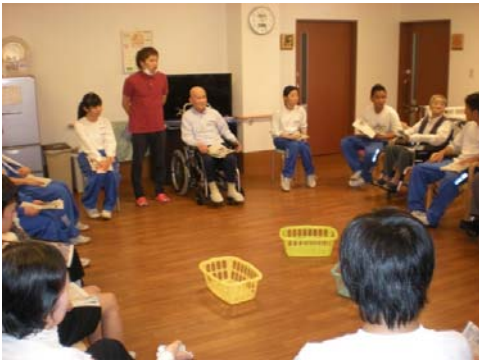
中学生とのふれあい 一緒にゲームをしたり、歌を唄ったり・・・