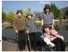
読書愛好会 図書館で本を借りました