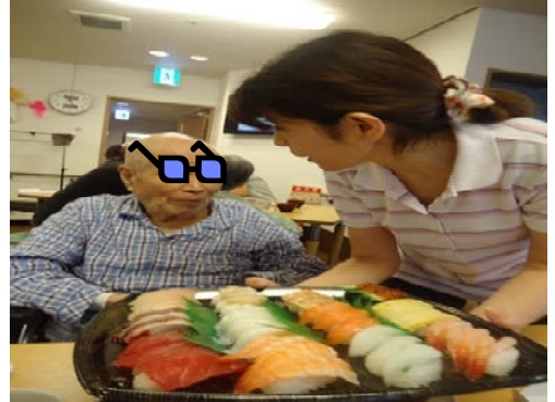
お寿司パーティ～ どれも食べたくて迷っちゃいます♪